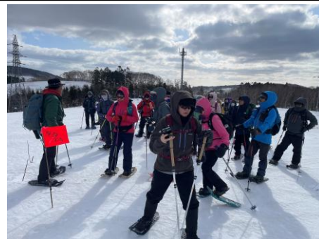
分水嶺イベントの様子