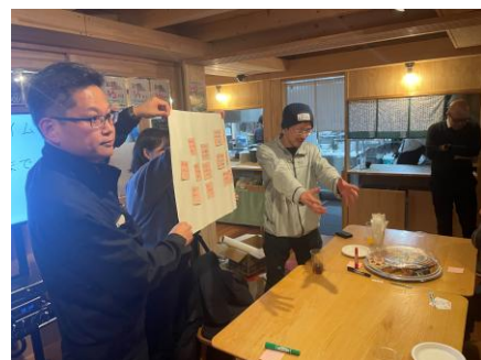
ワークショップの発表中の様子