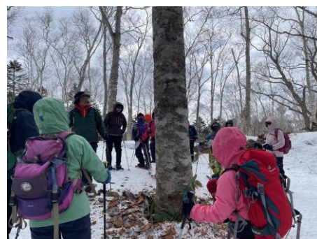
クマガワの食痕を眺める参加者