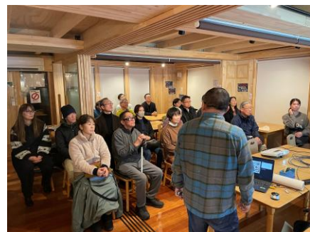
菊池氏の講演の様子